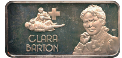
Silberbarren zu Ehren Clara Bartons in der Reihe „Our Greatest Americans“, 1974

Bei Beginn des Deutsch-Französischen Krieges lernte Clara Barton dann Großherzogin Luise von Baden kennen. Diese hatte bereits vor Jahren den Badischen Frauenverein gegründet, den Vorläufer des heutigen DRK-Landesverbands Badisches Rotes Kreuz. Durch Luise und ihren Frauenverein lernte Clara Barton das Rote Kreuz von der praktischen Seite her kennen und kümmerte sich um verletzte Soldaten beider Kriegsgegner. Luise und Clara begründeten eine lebenslange Freundschaft, ihre Korrespondenz wird in der Kongressbibliothek in Washington aufbewahrt.