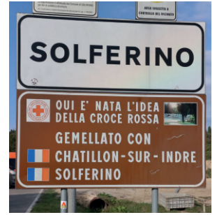
Das Ortseingangsschild von Solferino verweist auf die Bedeutung des Ortes: „Hier wurde die Idee des Roten Kreuzes geboren.“