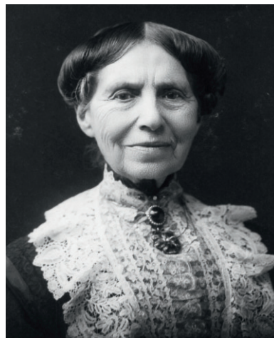
Clara Barton im Alter von 83 Jahren

Wegen gesundheitlicher Probleme, die sich zwischenzeitlich eingestellt hatten, empfahlen ihr die Ärzte eine Fernreise, weit weg von aller anstrengenden Beschäftigung. Für mehrere Jahre reiste Clara Barton nach Europa, doch rastlos blieb sie nicht. Zuerst traf sie 1869 in Genf Louis Appia, der sechs Jahre zuvor mit Henry Dunant zu den Gründern des Roten Kreuzes gehörte hatte. Er machte sie mit der neuen Organisation und ihren Grundsätzen vertraut, gab ihr Dunants Buch Eine Erinnerung an Solferino zu lesen; Dunant selbst lebte ja schon nicht mehr in Genf, sondern in Paris.